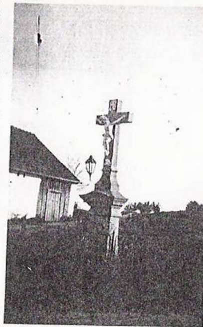
Kříž na rozezdě v Žárýmnicích,