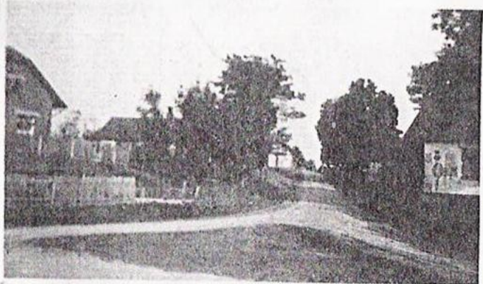
Nová ulice na Hornáčkovi