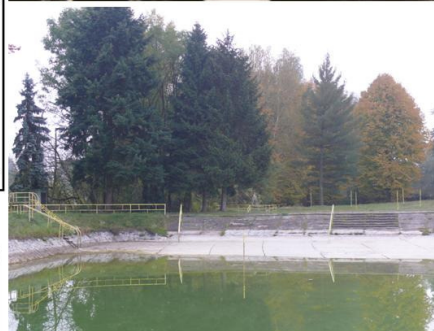
Horní konec od mostu