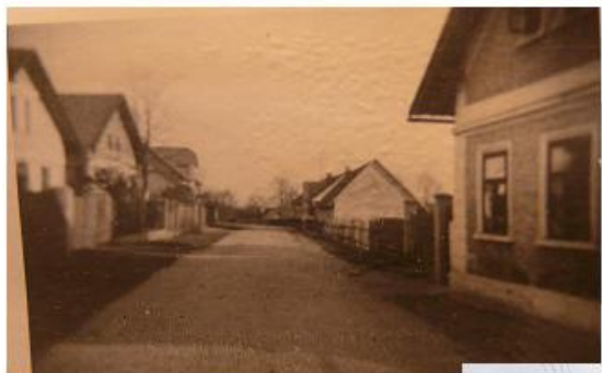
horní konec pohled na ulici od Zemánku nahoru