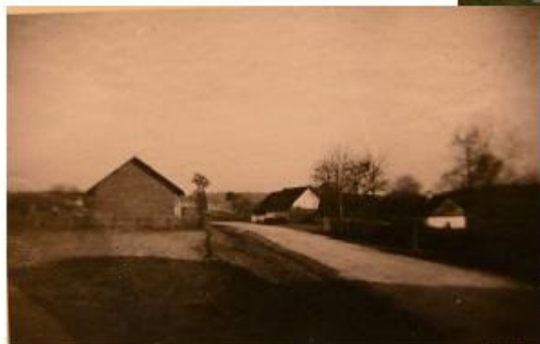
horní konec pohled na Hamerskovi