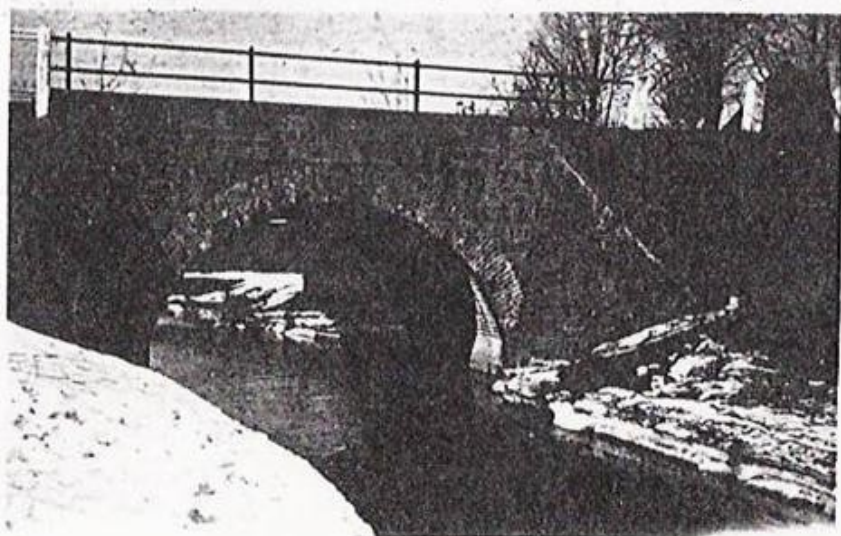
Most na Brodeci