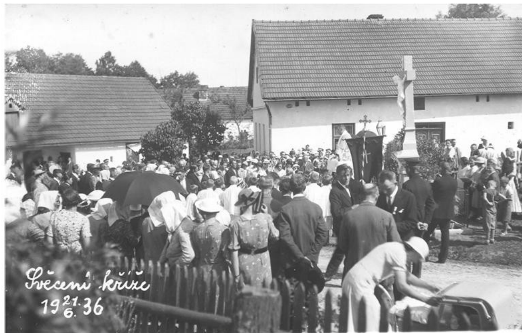
Svěcení kříže 19 21 .36