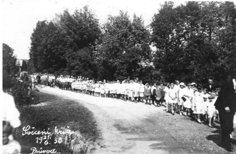
Svěcení křížku v Zárybniči 21.června 1936