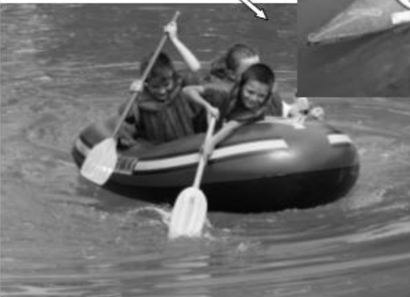
plavba přes koupálko nebyla opravdu jednoduchá