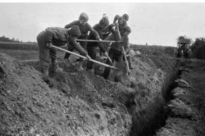
i mládež tenkrát pracovala