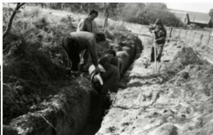
pokládka kanalizace kolem Vlasáků