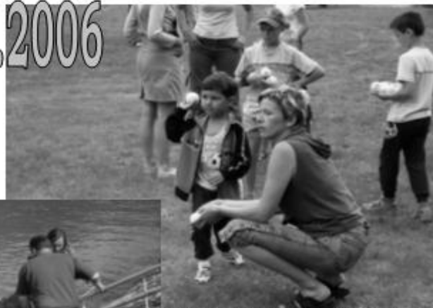
házění na panáka zvládaly děti na jedničku