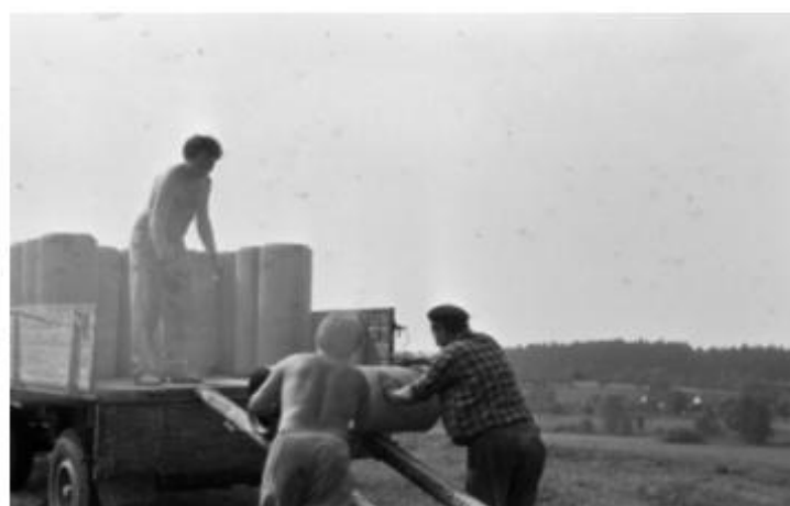
skládání potrubí-pěkně ručně