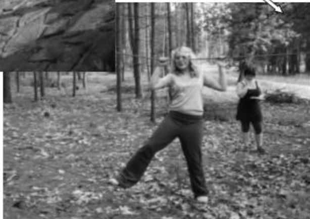
přechod provazové lávky