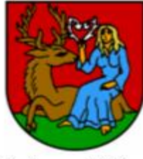
Rychnov nad Kněžnou