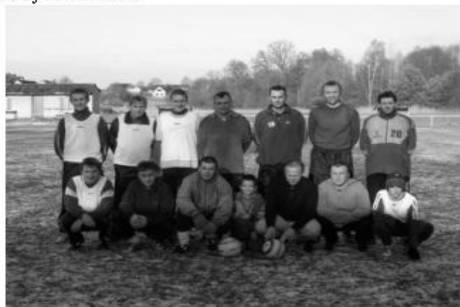
poslední den roku 2006 se sešli hráči i fanoušci při silvestrovském fotbalu